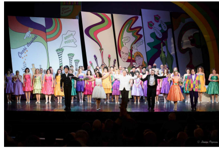
Elixirul dragostei, aplauze la rampa

Tiberiu Soare a condus cu mână sigură, rezolvând operativ izvoarele de decalaj scenă-fosă și a conferit spectacolului temperament, dar și coerență, echilibru. Tempouri bine cumpănite au dat eleganță paginilor cu specific „concertato”.